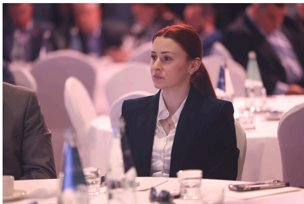
Business Breakfast · Ta' Qali, April 2026 · indirizzat mill-Prim Ministru Robert Abela.

Il-Viżjoni Malta 2050 qatt ma kellha l-għan li twaqqaf l-iżvilupp. L-iskop tagħha hu li twassal lil Malta lejn futur aktar sostenibbli, reżiljenti u orjentat lejn il-benessri, filwaqt li żżomm is-sahha ekonomika, il-kompetittività u l-mobbiltà soċjali.