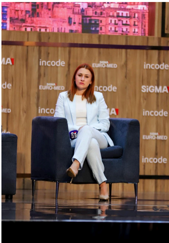
F'SIGMA Malta · fuq il-panel Euro-Med dwar l-innovazzjoni Mediterranja u l-infrastruttura diġitali, 2025.