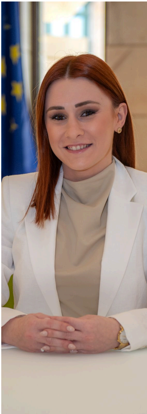
Cressida Galea fil-Parlament ta' Malta. Ritratt mehud fl-okkażjoni tal-hatra taghha bhala Membru Parlamentari.